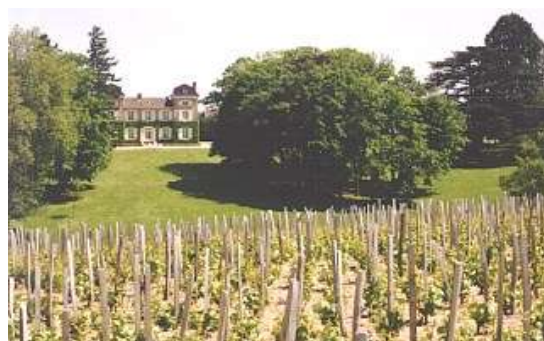
Figure2 : Chénas