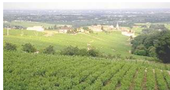
Figure 1 : Fleurie